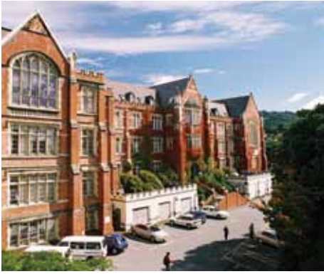
بناية هنتر، حرم كيلبيرن