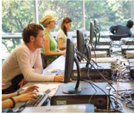
طلبة في المكتبة الرئيسية، حرم كيلبيرن