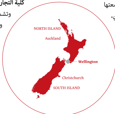
ولنتون، عاصمة نيوزيلندا

وتشمل مجالات الدراسة المحاسبة، والقانون التجاري، والتجارة الإلكترونية، والاقتصاد القياسي، والاقتصاد، وإدارة شؤون العاملين والعلاقات العامة، ونظم المعلومات، والأعمال الدولية، والإدارة، والتسويق، والمال والتمويل، والسياسات العامة، وإدارة السياحة.